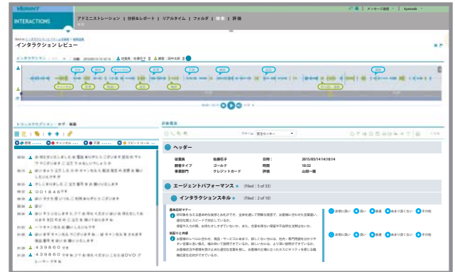
話者分離、感情表示に対応したテキスト同期再生画面。キーワード、波形、全文テキストをクリックしてのスキップ再生が可能

Verint 会話音声分析は顧客対応の会話を分析し、収益増大、コスト削減、リスク回避や企業戦略の方向性決定に必要な情報を収集します。成約に繋がるトーク、コスト増大の原因、顧客ニーズ、ビジネスチャンス、コンプライアンス遵守など、業務改善が必要な社内プロセスを特定することが可能になります。Verint® 通話録音やVerint® 対応品質管理を組み合わせると、通話録音から音声分析さらには対応品質評価まで一気通貫でカバーすることができます。また、NGワードの抽出とトークスクリプトの分析によるコンプライアンスの強化、感情認識によってクレームの原因分析に利用することも可能です。