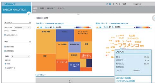
週間から年間まで、様々な期間範囲で急増減した語句を自動的に発見し、顧客の傾向を把握

Verint 会話音声分析は、期間内に最も出現頻度が変化した語句を全通話から自動的に発見します。トレンド分析では、語句指定が一切不要であり、予想外の急増減語句の発生を把握でき、また、予めキーワードを設定しておいて、それを含む通話の増減を把握することもできます。この傾向の発見と証明により、問題に対して先見性をもった対策を実施することが可能になります。