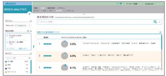
相関性の高い語句により通話群を同一内容に自動的にグループ化

の通話群にまでグループ化され、顧客の架電理由を即座に把握することが可能になります。